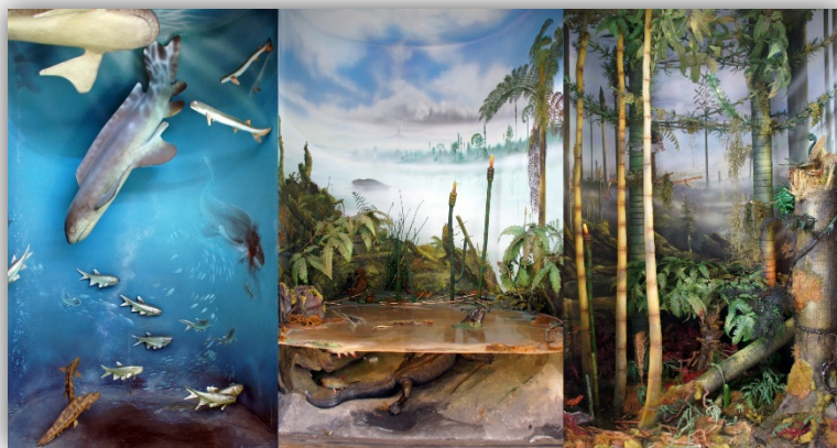
Umweltmuseum GEOSKOP auf Burg Lichtenstein