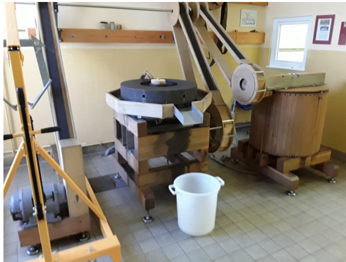
Öl- und Senfmühle