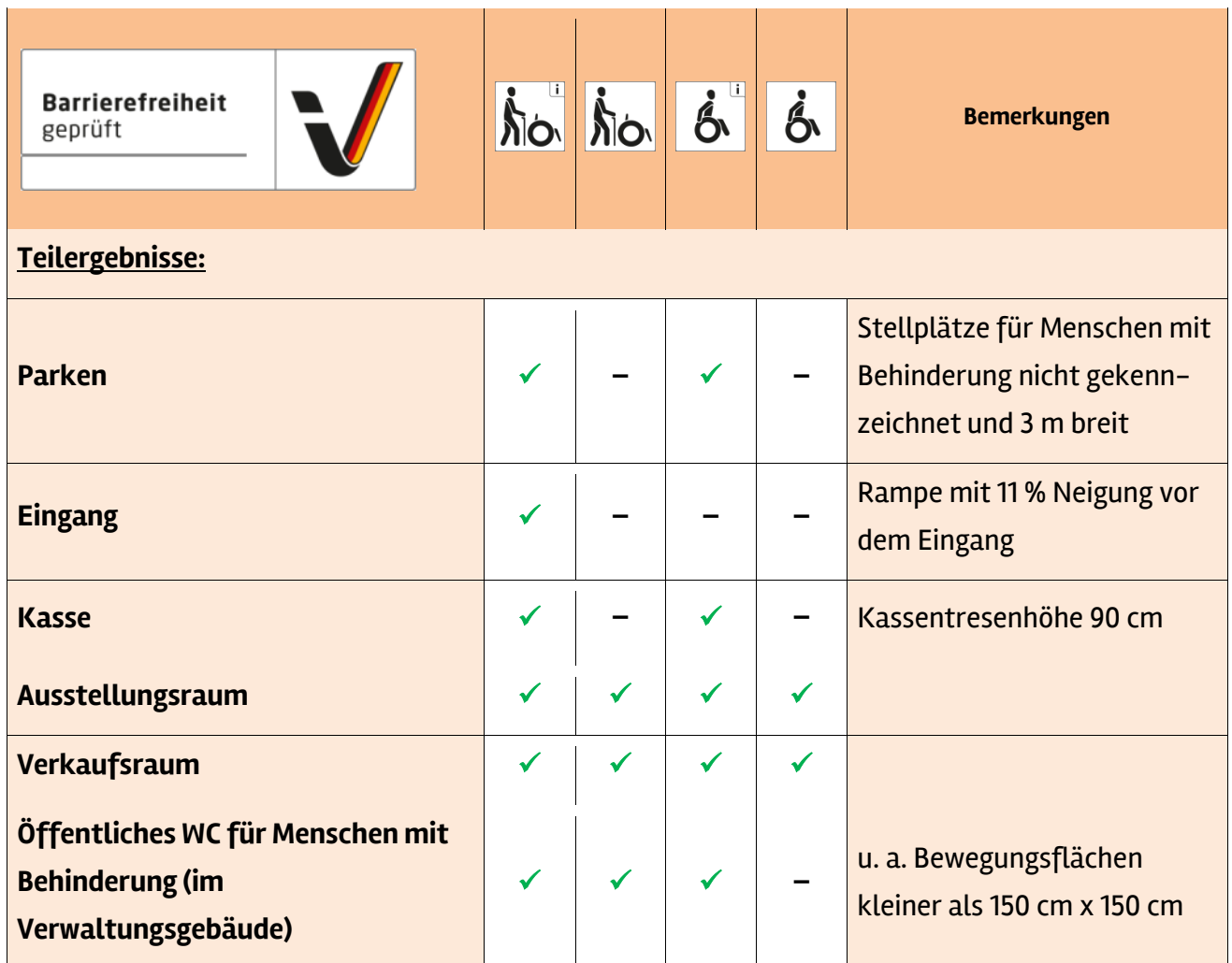
Tabelle 1: Überblick über das Prüfergebnis